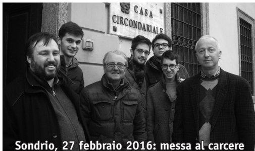
Sondrio, 27 febbraio 2016: messa al carcere