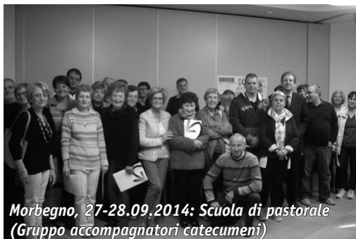
Morbegno, 27-28.09.2014: Scuola di pastorale (Gruppo accompagnatori catecumeni)

Il Foglio parrocchiale lo si può trovare anche consultando