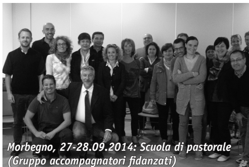
Morbegno, 27-28.09.2014: Scuola di pastorale (Gruppo accompagnatori fidanzati)

Veglia di preghiera con la croce di Lampedusa