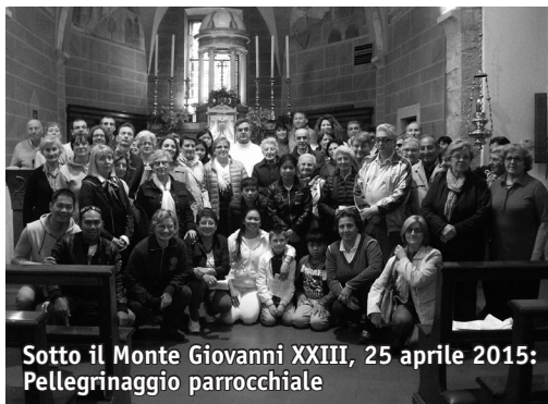
Sotto il Monte Giovanni XXIII, 25 aprile 2015: Pellegrinaggio parrocchiale