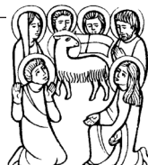
TUTTI I SANTI

(Dopo la Messa delle ore 10 processione al cimitero)