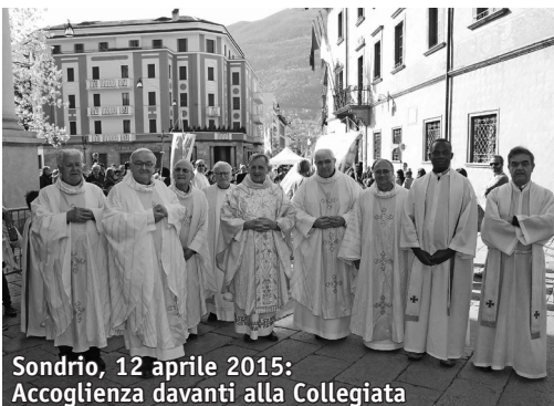
Sondrio, 12 aprile 2015: Accoglienza davanti alla Collegiata