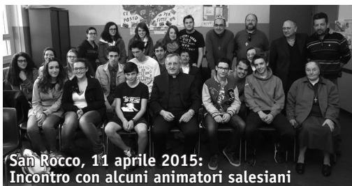
San Rocco, 11 aprile 2015: Incontro con alcuni animatori salesiani

Il Pellegrinaggio è un gesto di fede popolare a cui partecipano ogni anno decine di migliaia di persone, soprattutto giovani. Il cammino notturno si snoda attraverso 28 chilometri tra le colline marchigiane scandito dalla preghiera, dal canto e dal silenzio.