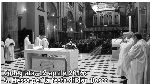
Collegiata, 12 aprile 2015: S. Messa per la festa di don Bosco