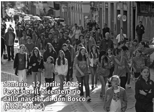
Sondrio, 12 aprile 2015: Festa per il bicentenario dalla nascita di don Bosco (1815-2015)