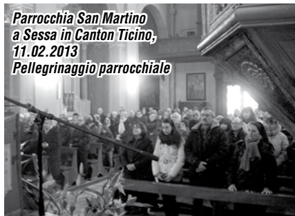
Parrocchia San Martino a Sessa in Canton Ticino, 11.02.2013 Pellegrinaggio parrocchiale