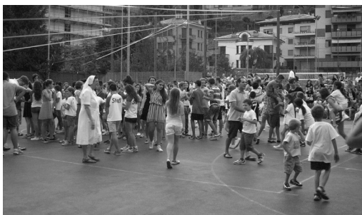
S. Rocco, 05.07.2013: Festa del Grest