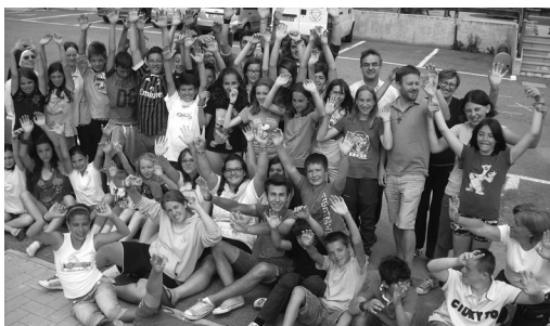
Oga, 05.07.2013: Campo estivo 5ª elem. e 1ª media