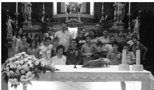
Collegiata, 03.07.2013: Campo estivo di Faloppio