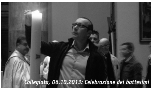
Collegiata, 06.10.2013: Celebrazione dei battesimi