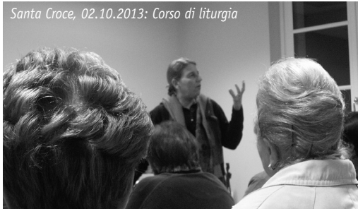
Santa Croce, 02.10.2013: Corso di liturgia

Il programma dettagliato in oratorio o su www.parrochiesondrio.it/vicariato