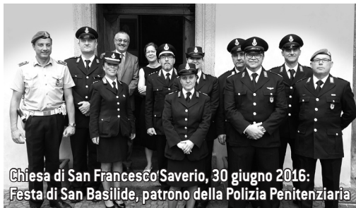
Chiesa di San Francesco Saverio, 30 giugno 2016: Festa di San Basilide, patrono della Polizia Penitenziaria