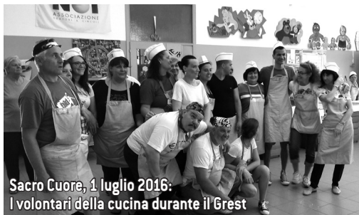
Sacro Cuore, 1 luglio 2016: I volontari della cucina durante il Grest