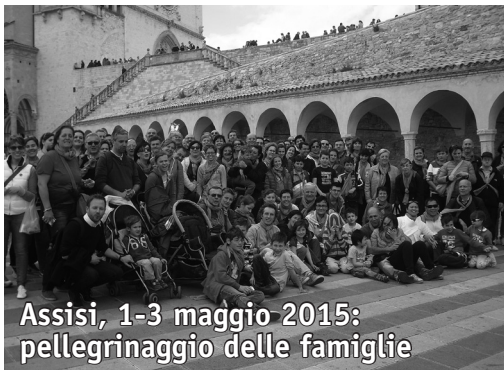
Assisi, 1-3 maggio 2015: pellegrinaggio delle famiglie