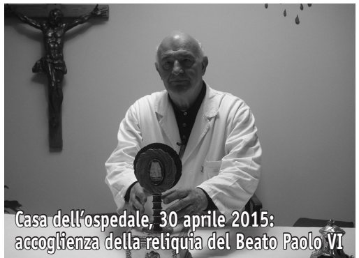
Casa dell'ospedale, 30 aprile 2015: accoglienza della reliquia del Beato Paolo VI