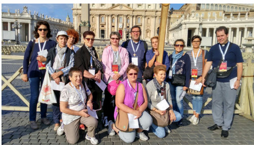
Vaticano, 24.09.2016: Giubileo dei catechisti