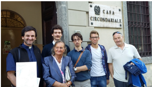
Sondrio, 24.09.2016: Messa al carcere