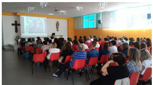
S. Cuore, 24.09.2016: Aggiornamento catechisti