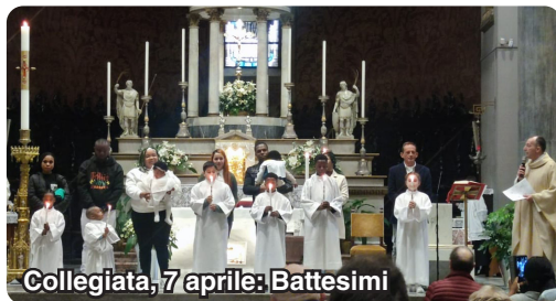
Collegiata, 7 aprile: Battesimi

Inoltre, si è deciso di iniziare a raccogliere i preventivi per il rifacimento dell'impianto elettrico e di illuminazione della chiesa della Beata Vergine del Rosario perché ormai non più adeguato alle normative vigenti.